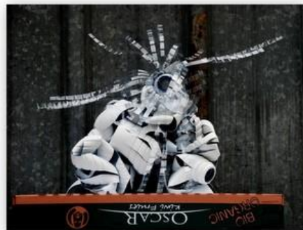
la gardienne du temple 1m

avec un même bout de plastique (détails dans le site ) élucubrations