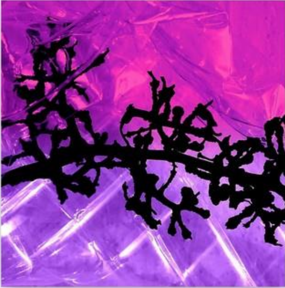
comme un vitrail