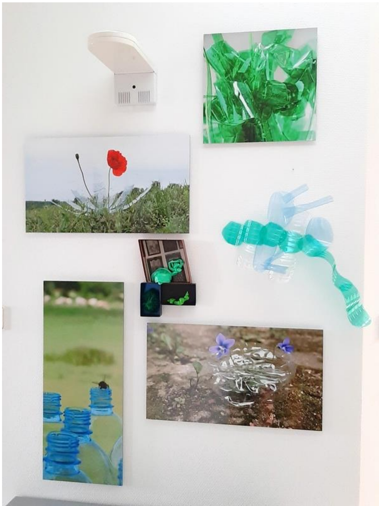
ensemble « Printemps » libellule vers de terre bourdon sont à l'œuvre et les fleurs aussi installation Ribeauvillé