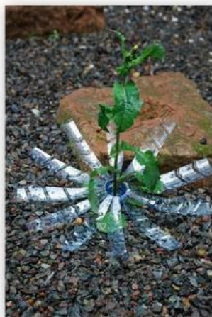
un rien de chardon