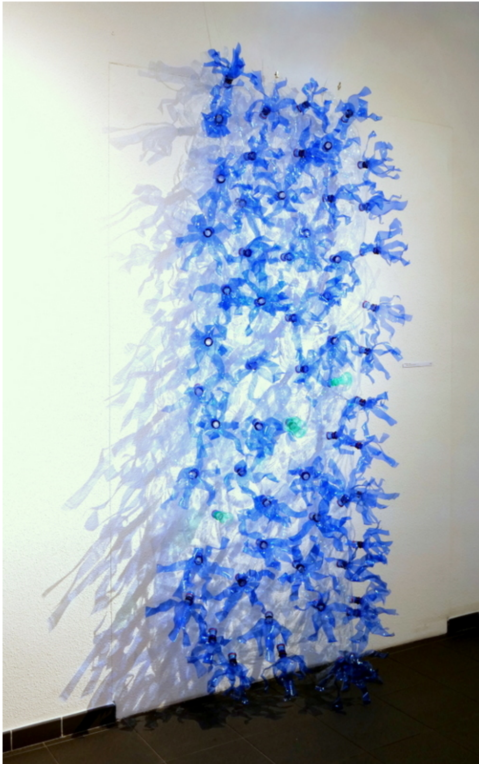
couvert de jacinthes expo ribeuville 2021 installation avec découpes plastiques