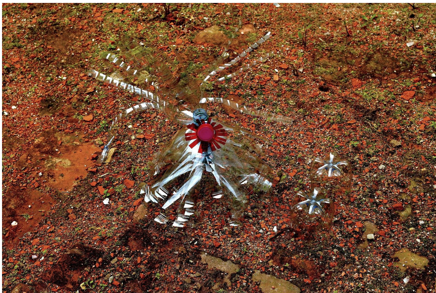
allunie sur jupiter composition numérique imprimée contrecollée sur dibond 75 cm L