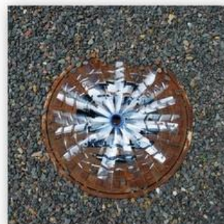
étoile de terre 65/65